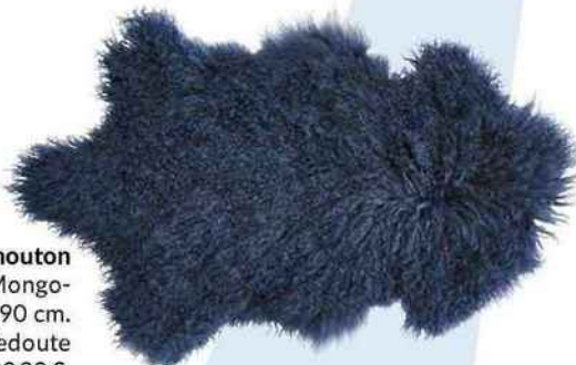
Peau de mouton en laine de Mongolie , 55 x 90 cm. « Osia », La Redoute Intérieurs, 129,99 €.