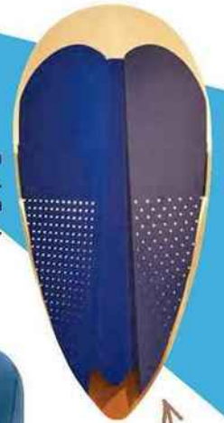
Applique en métal , H 46,5 cm. « Sorcier », La Chance, 349 €.