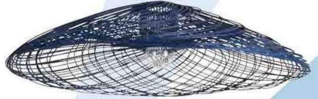
Suspension en rotin , Ø 55 cm. « Satelise », Forestier chez Lightonline , 240 €.