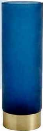
Vase en verre et aluminium , Ø 10 cm, H 30,5 cm. « Twist », Bo Concept, 68 €.