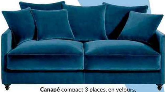
Canapé compact 3 places , en velours, structure en pin massif, L 198 cm. « Lazare », AM.PM, 1790 €.