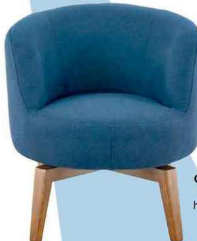
Chaise en tissu , pied rotatif en hêtre. « Naomi », Fly, 299,90 €.