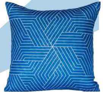
Coussin en lin , 35 x 35 cm. « Tallinn », Rouge du Rhin, 59 €.